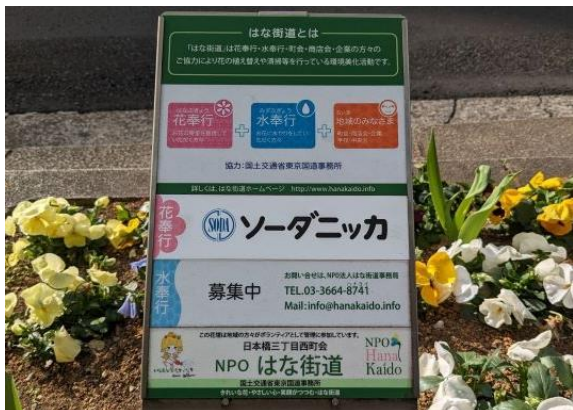
↑ 社名入りプレート