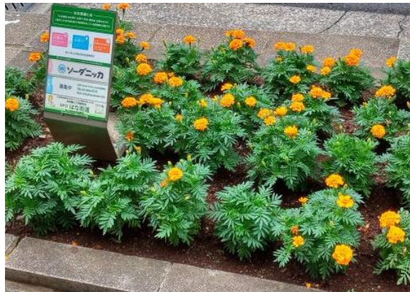
↑ 2022年10月：フレンチマリーゴールド