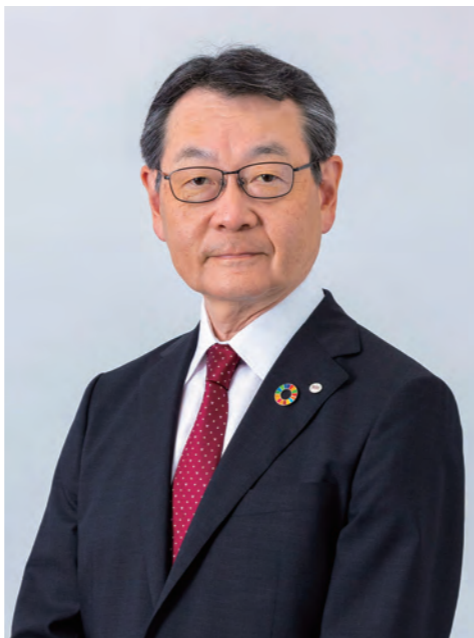
代表取締役 社長執行役員

また、環境貢献活動や持続可能な開発目標（SDGs）及びコンプライアンス・ガバナンスに対する取組みを経営における最重要課題のひとつと位置づけ、ESGを重視した経営を行い、財務面・非財務面の両面の充実によりステークホルダーの皆様の信頼に応えてまいります。